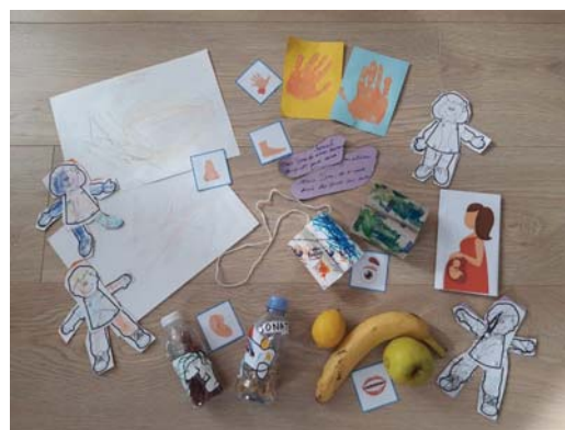
Activités réalisées avec les 0-3 ans

Nous avons la conviction que chaque enfant est le bienvenu et qu'il a sa place dans l'Eglise. En tant qu'équipe, notre mission est de compléter le rôle premier des parents, qui est déjà mentionné dans le Deutéronome (6.6-7) :