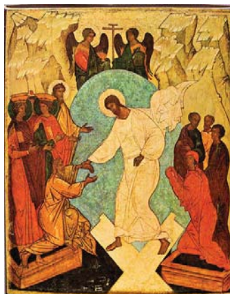
Christ ressuscité sauve l'humanité

La mort physique est la plupart du temps irréversible, la mort spirituelle ne l'est pas. Car la communion avec Dieu, grâce à son infinie patience, sa bonté et son amour pour l'humanité, peut être rétablie à tout moment. C'est l'histoire du fils prodigue. Lorsqu'il se repent de sa rupture avec son Père et qu'il revient vers lui, ce dernier lui dit : « mon fils que voici était mort et il est revenu à la vie » (Lc 15.24).