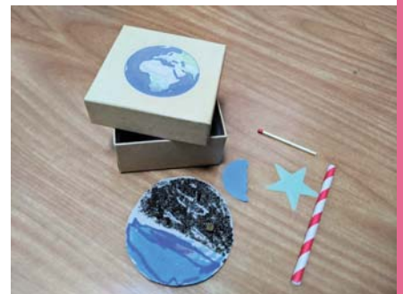
Boîte de la création

Ces prochains jours, nous vous invitons à lire avec vos enfants le récit de la création (Genèse 1 et 2), si possible dans une Bible pour enfants. Ils pourront ainsi découvrir la création dans leur vie de tous les jours en attendant de nous revoir à l'Eglise.